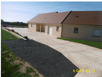
Le Gîte à Riton LESME

des visites de monuments et châteaux vous garantiront de belles vacances.