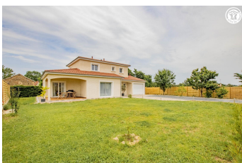
Gîte du Pallat

Composition : Maison individuelle voisinant la maison des propriétaires (totale indépendance). Wifi (fibre). Chauffage PAC. Gîte sur deux niveaux. Rdc : séjour- cuisine-salon (1 convertible 1 p. 115x190cm en appoint), 1 chambre (lit 2 p. 160x200cm) avec salle d'eau privative (douche), Wc indépendant. 1er étage : 3 chambres (lit 2 p. 140x190cm / 2 lits 1 p. 100x200cm / lit 2 p. 140x190cm), salle de bain (baignoire), Wc indépendant. Terrasse couverte + jardin clos (150m 2 ) + garage (1 place) + local vélos + parking privés. Toutes commodités dont supermarchés à 5 km.