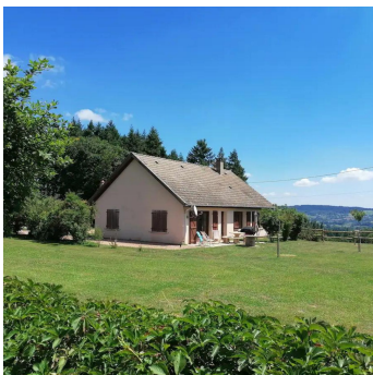
Le Moulin DYO

et d'un coin repas pour profiter de la gastronomie locale. Le wifi est disponible. La cuisine est équipée d'un lave-vaisselle, d'une cuisinière à gaz, d'un frigo-congélateur, d'une cafetière, d'une bouilloire, d'un grille-pain et d'un micro-ondes. Un lave-linge est également à votre disposition. Le logement possède 7 couchages + 1 lit bébé + un lit parapluie sur demande + 1 lit d'appoint (canapé convertible 1 personne). La salle de bain et les WC sont indépendants. Afin d'être serein dès le début de votre séjour, les lits seront faits à votre arrivée. Le linge de toilette n'est pas fourni.